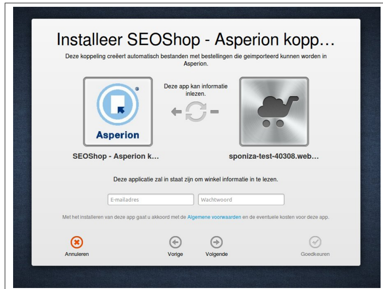
Fig. 1: Startscherm installatie SEOshop - Asperion koppeling

De koppeling tussen SEOshop en Asperion kan gelegd worden vanuit het AppCenter van SEOshop. Klik op de icoon, dan krijgt u het volgende scherm te zien: