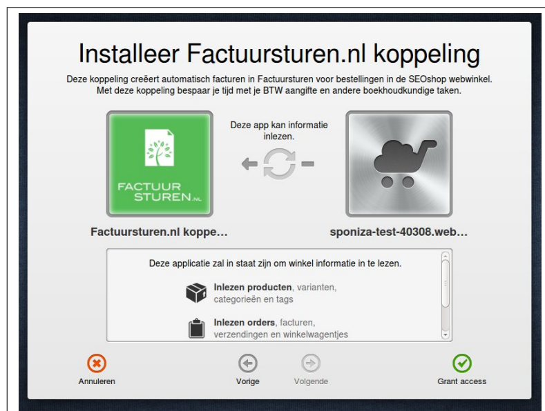
Fig. 2: Leesrechten SEOshop - Factuursturen koppeling

Vul de gebruikersnaam en het wachtwoord van de webwinkel in. De webwinkelier wordt er op geattendeerd dat de koppeling toegang krijgt tot de gegevens van de SEOshop webwinkel. Deze toegang moet expliciet gegeven worden. De SEOshop - Factuursturen koppeling zal alleen gegevens uit de webwinkel lezen. De koppeling zal deze gegevens niet wijzigen.