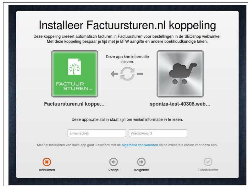
Fig. 1: Startscherm installatie SEOshop - Factuursturen koppeling

De koppeling tussen SEOshop en Factuursturen kan gelegd worden vanuit het AppCenter van SEOshop. Klik op de icoon, dan krijg je het volgende scherm te zien: