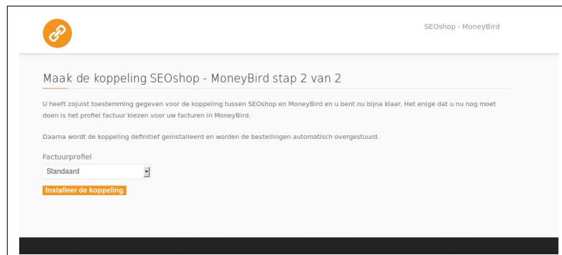
Fig. 4: Selecteer een van de factuurprofielen van je MoneyBird account