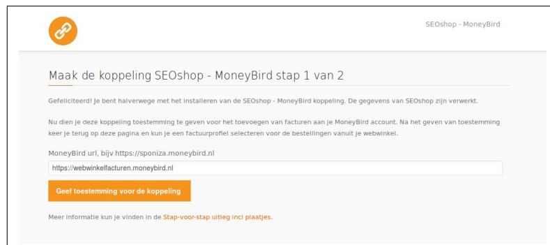
Fig. 2: Scherm voor het invullen van je MoneyBird account en het autoriseren van de koppeling

Je wordt nu automatisch doorgeleid naar een scherm binnen je MoneyBird account waar je de koppeling