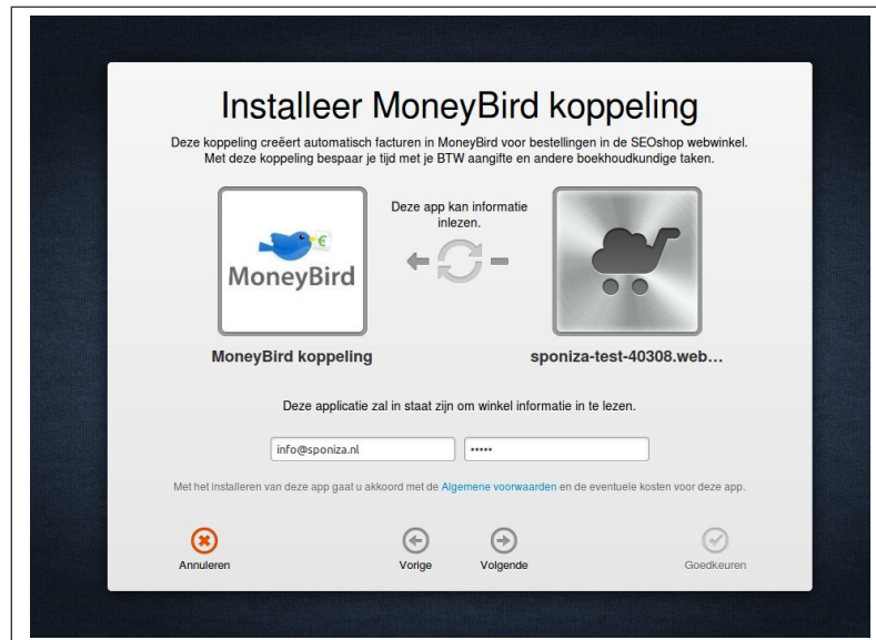
Fig. 1: Startscherm installatie SEOshop - MoneyBird koppeling

De koppeling tussen SEOshop en MoneyBird kan gelegd worden vanuit het AppCenter van SEOshop. Klik op de icoon, dan krijg je het volgende scherm te zien: